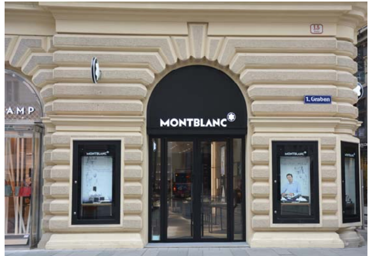
Außenansicht der neuen Montblanc-Boutique in Wien.