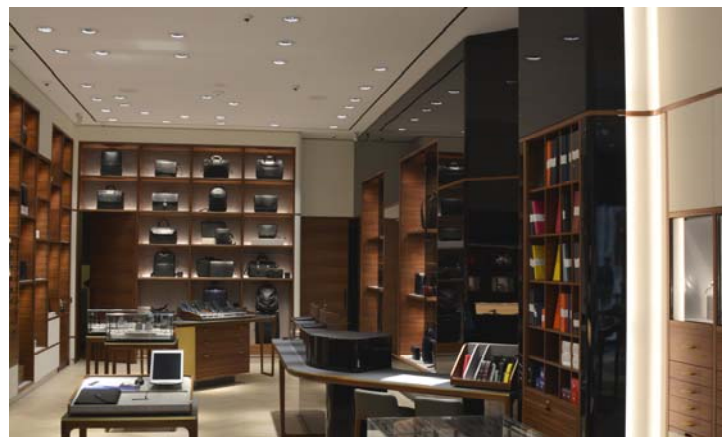
Verkaufsraum ausgestattet mit INDUL Schlitzdurchlässen von Kiefer.