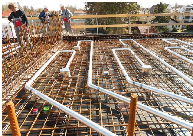
Bild 3. Montage des Lüftungssystems CONCRETCOOL

Als Messgröße der Deckentemperatur dienen die an den verschiedenen Deckenauslässen montierten Referenztemperaturfühler. Die Messung der Zulufttemperatur direkt am Deckenauslass erlaubt eine annähernd der Deckentemperatur entsprechende Temperaturerfassung. Um die Deckentemperatur zu ermitteln, wird die Lüftungsanlage einmal pro Nacht für ca. 10 Minuten nach folgenden Kriterien eingeschaltet. Ist die Außentemperatur < 12 °C,