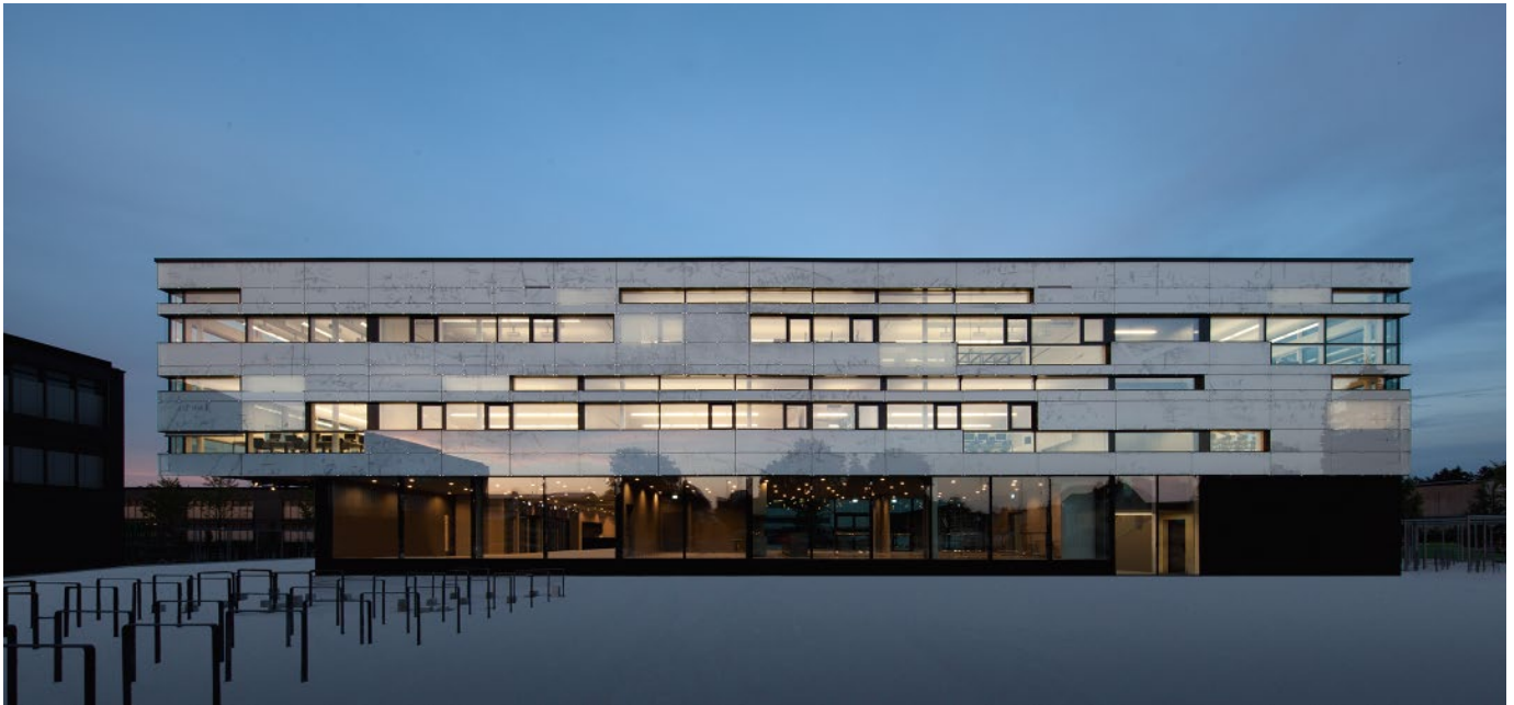
Bild 1. Frontansicht der Sebastian-Lotzer-Realschule Memmingen

Die Planungsgrundlage für die Luft- und Klimatechnik war das vom Ingenieurbüro Güttinger Kempten erarbeitete Energiekonzept für die Gebäudetechnik. Das zum Einsatz gekommene BTA-Lüftungssystem CONCRET-COOL, das die positiven Eigenschaften einer Bauteiltemperierung und einer Lüftungsanlage vereint, ist im Bereich der Gebäudetechnik einer der wesentlichen Bausteine zur Umsetzung des Energiekonzepts.