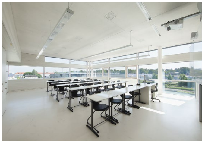
Bild 2. Klassenzimmer mit Ausblaseelementen

ca. 21 °C komplett ohne Nacherhitzer erreicht. Primärenergie wird dafür nicht benötigt. Der Prozess erfolgt selbstregulierend und fast schwankungsfrei mit hoher Stabilität der Temperatur aufgrund der großen Speicherkapazität der Betondecken. CONCRETCOOL ist somit eine Symbiose zwischen Bauteiltemperierung und Zuluftanlage und schafft Behaglichkeit bei hoher Energieeffizienz durch maximale Ausnutzung der freien Kühlung. Der Wärmerückgewinn der RLT-Anlage wird durch die Ergänzung mit dem System CONCRETCOOL auf über 95 % gesteigert.