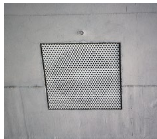
Bild 4. Deckenbündige Zulufteinbringung

Die optische Anforderung bei diesem Projekt war eine durchgehend glatte Betondecke. Dies zu gewährleisten, war ohne eine Änderung der Ausblaselemente nicht möglich. Die Auslasskästen sind mit Abstand zur Deckenunterkante in die Decke eingegossen und das Ausblaselement ist rückversetzt, oberhalb der Deckenunterkante, montiert und zusätzlich mit einem deckenbündig angebrachten Lochblech verkleidet. Um bei dieser Anordnung weiterhin die strömungstechnischen Eigenschaften zu gewährleisten, wurde im Vorfeld im Entwicklungslabor von Kiefer Luft- und Klimatechnik eigens für dieses Projekt ein 1:1-Versuchsaufbau durchgeführt. Dadurch konnten über entspre-